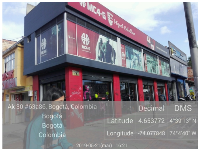
Registro fotográfico del 21-05-2019. Operativo de Control Ruta Crítica 5 – Avenida Carrera 30